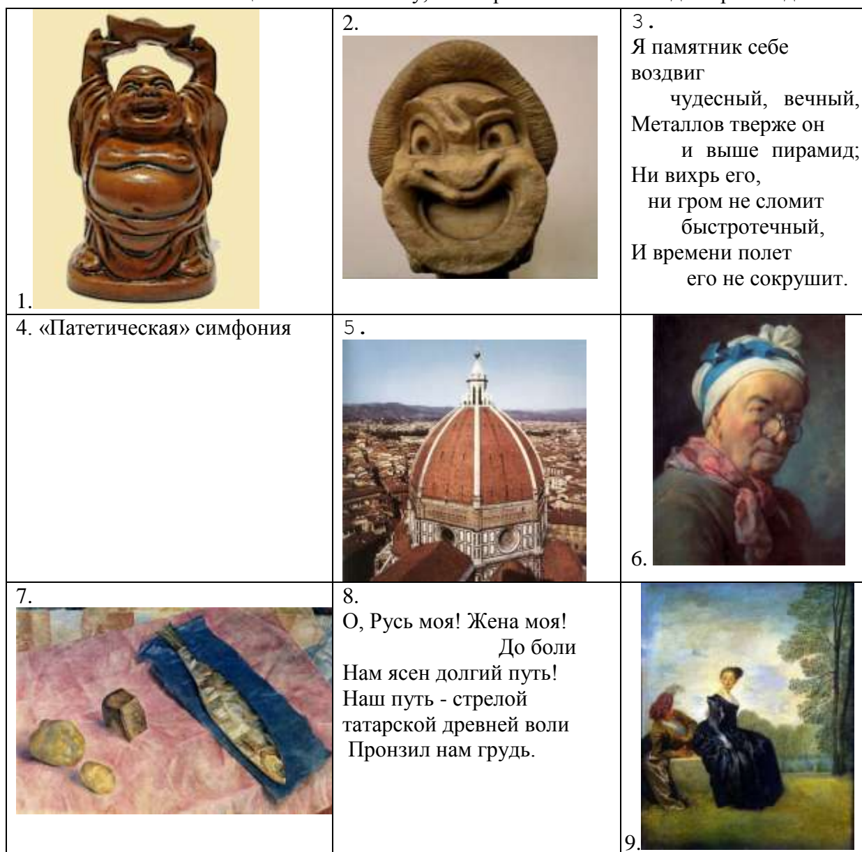
Таблица к заданию 7