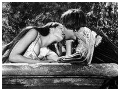
Подсказка к заданию 5.